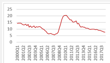
3. attēls. Nodokļu ieņēmumi un valsts sociālās apdrošināšanas obligātās iemaksas pret IKP