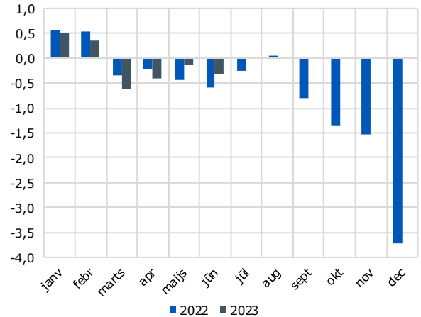
Konsolidētā kopbudžeta bilance, % no IKP, uzkrātās vērtības katra mēneša beigās

2023. gada jūnijā pārpalikums bija pašvaldību budžetā 0,2% no IKP, savukārt deficīts bija pamatbudžetā 0,5%. Speciālā budžeta bilance jūnijā bija sabalansēta.