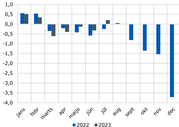
Konsolidētā kopbudžeta bilance, % no IKP, uzkrātās vērtības katrā mēneša beigās

2023. gada jūlijā konsolidētā kopbudžeta bilance bija pozitīva, tās pārpalikums bija 0,2% apmērā no prognozētā IKP jeb 88 milj. eiro. Gadu atpakaļ (jūlijā) kopbudžeta bilancē bija deficīts 0,3% no IKP jeb 98 miljoni eiro. Salīdzinot ieņēmumus un izdevumus 2023. gada jūlijā ar ieņēmumiem un izdevumiem 2022. gada attiecīgajā mēnesī, ir novērojams ieņēmumu pieaugums par 1,1 miljrd. eiro jeb 14%. Savukārt izdevumi jūlijā, salīdzinot ar 2022. gada jūliju, pieauga par 955 milj. eiro jeb 12%. Šī gada jūlijā, salīdzinot ar iepriekšējā gada jūliju, bilance ir uzlabojusies par 0,5 procentpunktiem jeb 186 miljoniem eiro. 2023. gada jūlijā pārpalikums bija pašvaldību budžetā 0,2% no prognozētā IKP un tāds pats pārpalikums bijis speciālā budžetā, savukārt pamatbudžetā bija deficīts 0,3%.