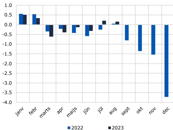
Konsolidētā kopbudžeta bilance, % no IKP, uzkrātās vērtības katra mēneša beigās

2023. gada augustā pārpalikums bija pašvaldību budžetā 0,2% no prognozētā IKP, speciālā budžetā 0,3%, savukārt pamatbudžetā bija deficīts 0,4%.